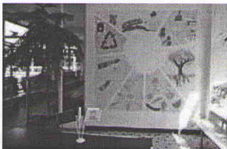
Ekoškola se může pochlubit vlastním ekokodexem.

ritativní činnost, aby rodiče handicapovaných dětí mohli zaplatit speciální tělocvik v lázních Klimkovic. Žáci ekotýmu pracují na fresce chráněných druhů zvířat a plní se 5. projekt Operačního programu vzdělávání pro konkurenceschopnost „Společná cesta ke vzdělání“. V něm nabídli žákům doučovací bloky a různé aktivity.