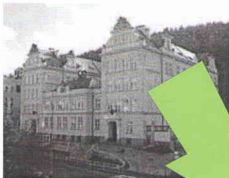
Dnešní podoba školy

Hezké jubileum 110 let od svého založení oslaví v letošním roce ZŠ Dukelských hrdinů. Na počest tohoto výročí proběhne 28. května od 17 hodin ve velkém sálu LS Thermal Školní akademie. Vedení školy zve všechny rodiče a přátele školy, aby se přišli podívat na bohatý program, který si připravili žáci pod taktovkou svých pedagogů. V rámci oslav jubilea se bude také konat Den otevřených dveří. V sobotu 20. září budou od 10 do 16 hodin zpřístupněny návštěvníkům všechny prostory školy. Rodiče, absolventi i pedagogové si mohou přijít zavzpomínat na dobu, kterou prožili v této krásné historické budově.