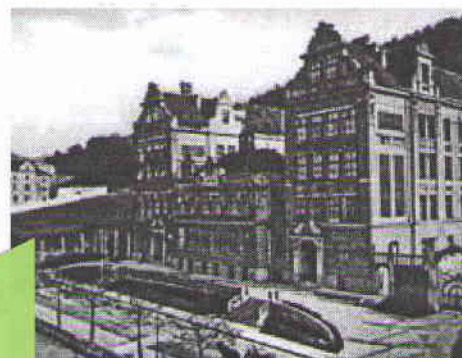
Jak vypadala před 110 lety